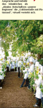
Miniköche-Spieler vor dem Zelt mit Sonnenblumen.