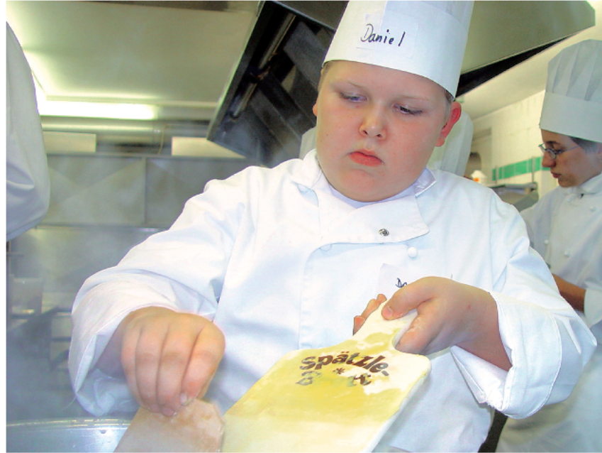
Kindliches Spiel an der Schwelle zur Berufswelt der Erwachsenen. Wer kann sich der Faszination der Miniköche schon entziehen?

Das gastronomische Handwerk lernen sie von den Chefs in Küche und Restaurant. Ein eigenes Spätzle Brett, Messer und die persönliche Kochuni-