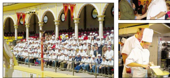
Erst die Arbeit – dann das Vergnügen: Die Miniköche lernen nicht nur servieren und kochen, sie bauen auch ihr Gemüse selbst an. Und ab und zu ernten sie die „Früchte“ ihrer Arbeit – zum Beispiel beim Ausflug in den Europapark.