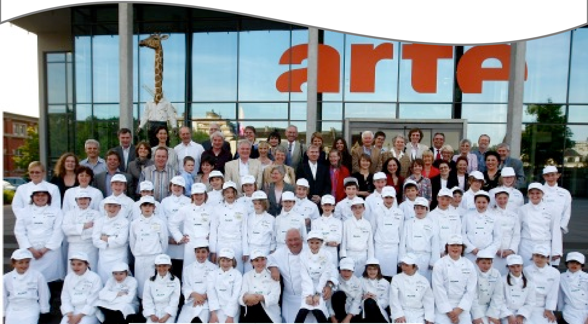
15 Jahre ARTE Magazin 25. April 2009 in Strasbourg