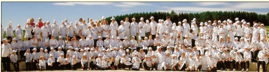
Die Weltrekord-Truppe der Miniköche nach dem erfolgreichen Versuch im zukünftigen Kräutergarten bei Albgold in Trochtelfingen-Haid.

EUROPÄISCHE MINIKÖCHE / Gala-Dinner auf der Mainau – Weltrekord in Oberschwaben