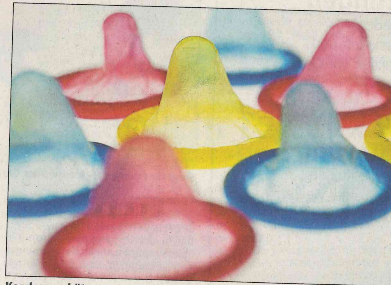
Kondome schützen vor sexuell übertragbaren Krankheiten, zum Beispiel auch gegen Syphilis.

Selbst Erwachsene, die schon mitten im Leben stünden, hätten rund um solche Krankheiten manchmal