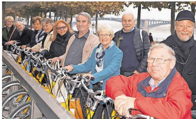
Die Seniorenvertreter aus dem Rhein-Pfalz-Kreis sind mobil!

Netzwerke für ein gutes Leben im Alter können nicht von „oben“ verordnet werden, es bedarf der Verknüpfung unterschiedlichster Kompetenzen sowie großen ehrenamtlichen Engagements, darüber waren sich die Seniorenvertretungen beim Erfahrungsaustausch zu Projekten aus ganz Rheinland-Pfalz einig. Wie lange kann ich noch mein Auto fahren? Ab wann bin ich zu alt? Ein Thema, das beim Seniorenkongress für angeregte Diskussionen sorg-