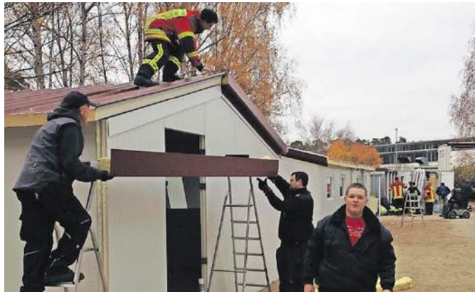
Die Feuerwehr beim Aufbau der Low-Cost-Häuser in Schifferstadt.

Bereits im September haben die politischen Gremien über die weitere Vorgehensweise beraten. Demnach sollen kurzfristig größere zur Verfügung stehende Gemeinschaftsunterkünfte genutzt werden. Hierbei handelt es sich insbesondere um große leerstehende Wohnobjekte oder nicht benötigte landwirtschaftliche Wohncontainer. Die Kreisverwaltung wird die Integration und die Organisation des Zusammenlebens in diesen Unterkünften durch zusätzliches Personal be-