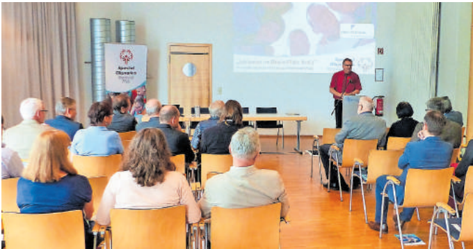
Begrüßung zum Aktionstag durch Landrat Clemens Körner