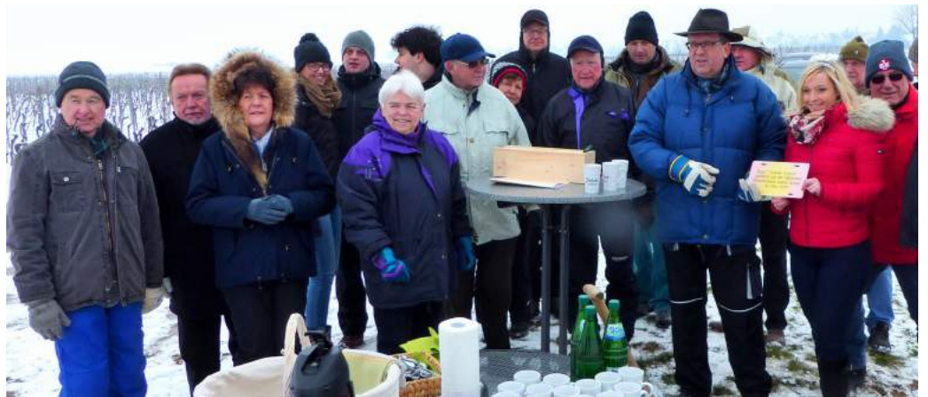
Weinpatinnen und –paten bei der Rosenpflanzung und Rebenschneiden im Landratswingert