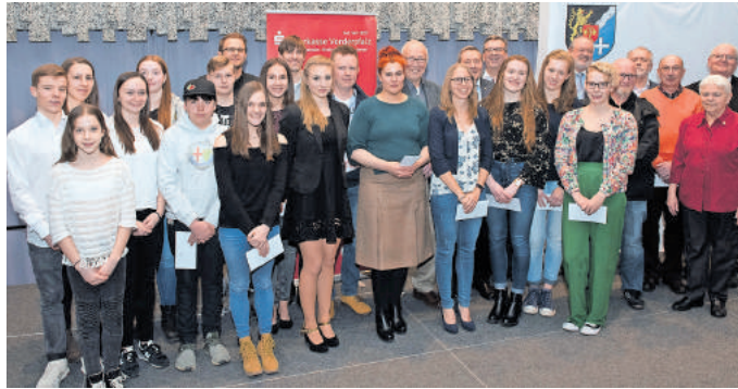
Geehrte Nachwuchstalente und Athleten aus dem Rhein-Pfalz-Kreis