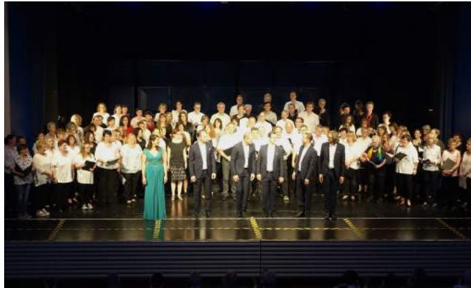
Gänsehaut pur: gemeinsamer Auftritt der Chöre mit dem A-cappella-Chor „Singer pur“

Was sich der Rhein-Pfalz-Kreis hat einfallen lassen, gab es in dieser Form bisher kaum. Das A-cappella-Ensemble „Singer Pur“ aus Stuttgart hat mit mehreren Chören aus dem Landkreis vor dem Konzert Stücke einstudiert, die sie am Abend aufführten. Ein großer Wunsch von Sängern ging so in Erfüllung: Mit Profis gemeinsam studieren und diese Stücke auf der Bühne vortragen. Das war