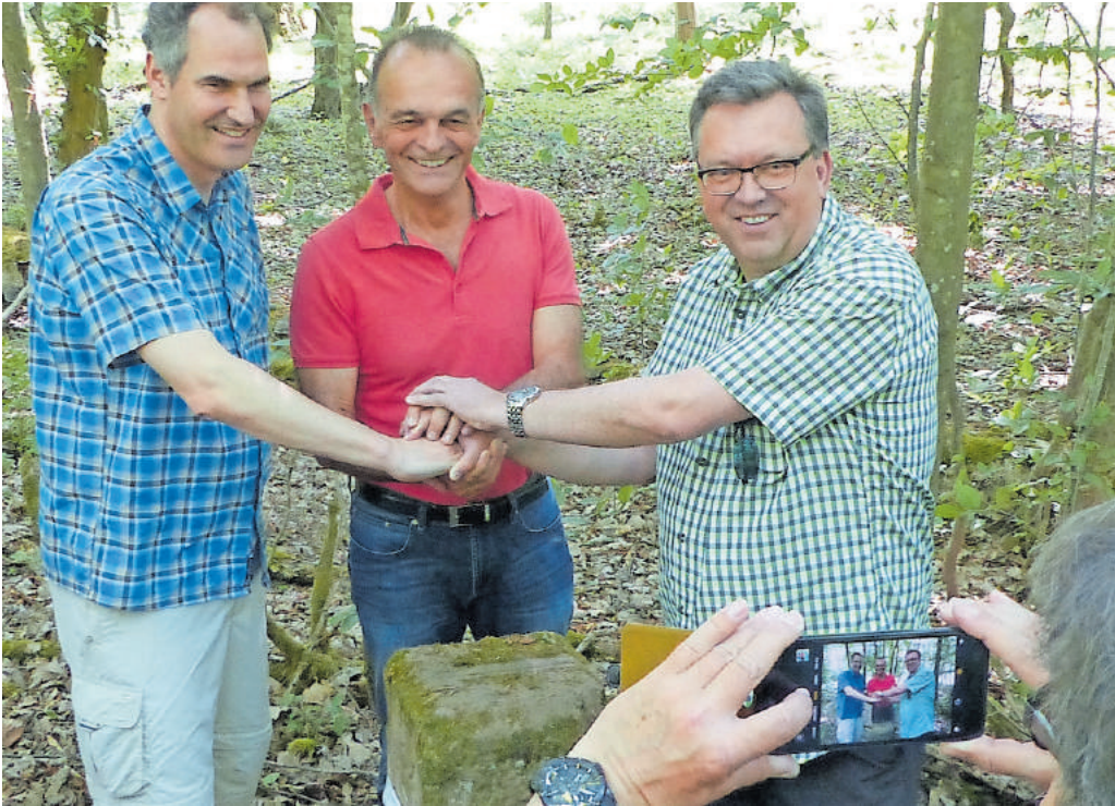
Bei den drei Landräte herrscht Einigkeit – nicht nur bezüglich der Kreisgrenzen

allen angenommen, so konnte doch die Natur nochmals ausgiebig und entspannt genossen werden.