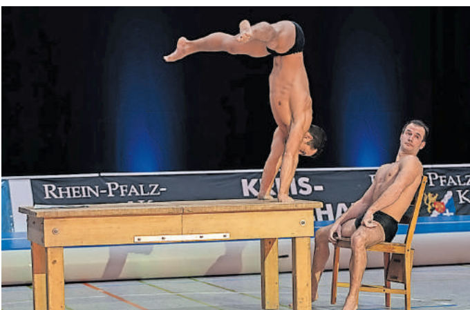
Akrobatische Höchstleistungen des Turnerduos „Showprojekt“ mit ihrer Darbietung Tablobatic