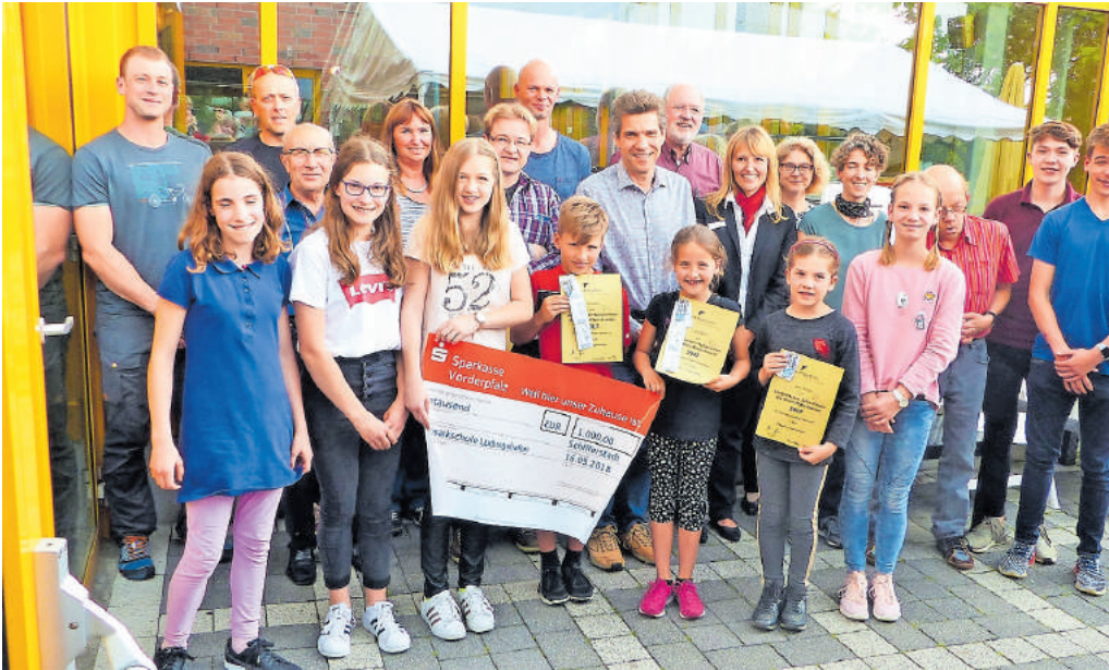
Teilnehmerinnen und Teilnehmer des Langstreckenschwimmens bei der Spendenübergabe

Rhein-Pfalz-Kreis. Zum wiederholten Mal wurde in den Kreisbädern des Rhein-Pfalz-Kreises zwischen Oktober und Dezember 2017 erfolgreich das Langstreckenschwimmen durchgeführt. Besucherinnen und Besucher konnten Kilometer für ein soziales Projekt erschwimmen. Diesmal wurde