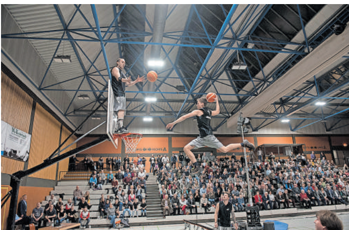
Powervolle Basketballshow der „Allstar dunkers“