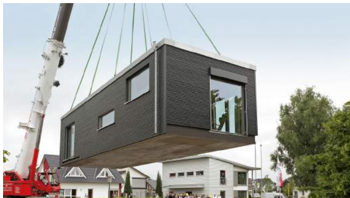
Bei Modulhäusern werden einzelne Hausmodule aus Leichtbauteilen industriell vorgefertigt und auf der Baustelle zusammengesetzt - quasi fertige Hausbereiche werden so im Ganzen auf die Baustellen gebracht.