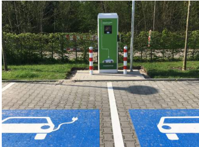
Elektroladestation am Kreisbad Heidespaß in Maxdorf

rufes des Bundes haben die Pfalzwerke mit dem Rhein-Pfalz-Kreis mögliche Standorte für Elektroladestationen abgestimmt. Mit jeder